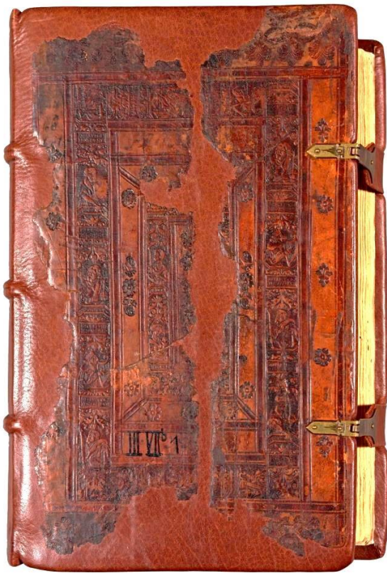
Stadtarchiv Chemnitz – Rothes Buch III VIb 1, Einband

genheiten. 13 Es gilt für das Stadtarchiv als das älteste überlieferte Urkundenverzeichnis. Für die Abfassung der Urkundentexte und deren Ausfertigung war der Stadtschreiber verantwortlich. Ihm oblag es auch, die städtischen Bücher zu führen. Für Anfang des 17. Jahrhunderts ist der Eid des Stadt- und Gerichtsschreibers erhalten. 14 Demnach hatten diese zu geloben, „auf die Bücher gute Achtung zu geben, welche jederzeit uffm Rathause verbleiben“ sollten. Der Stadtschreiber war ein juristisch gebildeter Beamter und stand außerhalb des Rates, also dem Gremium von Bürgermeister und Ratsherren.