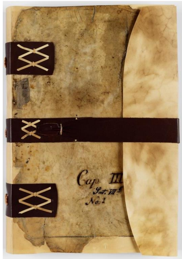
Stadtarchiv Chemnitz – Ratshandlungsbuch 1486 III VIIb 2, Einband

Das früheste Ratshandlungsbuch (Ratsprotokollbuch), das das Stadtarchiv verwahrt, beginnt 1486. 19 Es handelt sich um einen Band von 146 Blättern in weichem Pergamentumschlag. Ein Vorläufer befindet sich im Sächsischen Hauptstaatsarchiv – das sogenannte Geschoß- und Memorialbuch. 20 Es besteht aus 60 Blatt Pergament und beinhaltet zwei Teile. Der erste